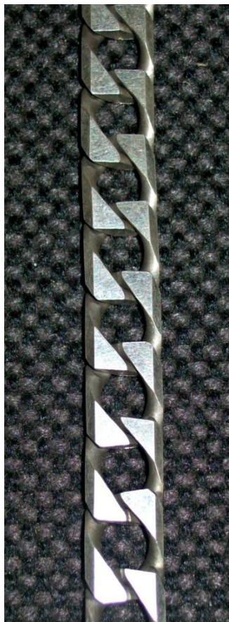
10 Lati. 10-Sides.

Lavorazioni possibili su catena / Available workings on the chain: