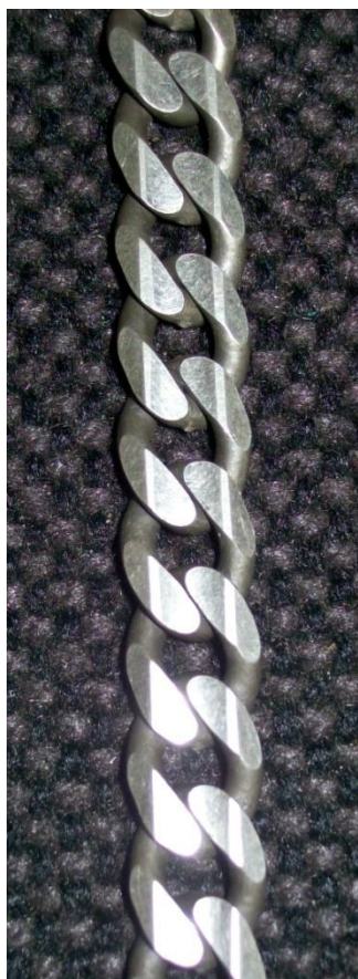
Piani, smussi ed incavati. Flats, bevels & hollows.