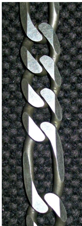
Piani e smussi. Flats & bevels.