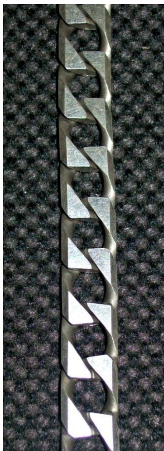
10 Lati. 10-Sides.

Lavorazioni possibili su catena / Available workings on the chain: