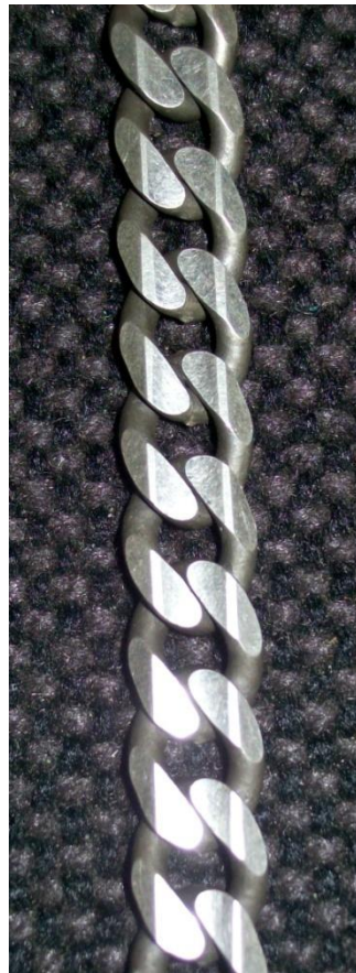
Piani, smussi ed incavati. Flats, bevels & hollows.