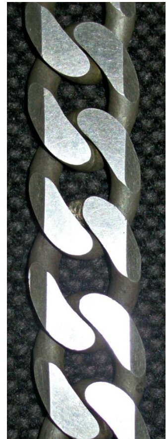
Piani e smussi. Flats & bevels.

Queste lavorazioni si possono fare su catene di qualsiasi misura.