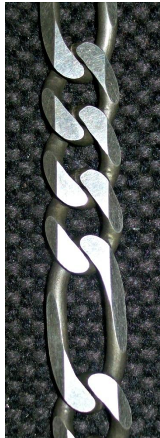
Piani e smussi. Flats & bevels.